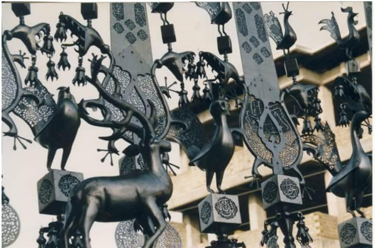
تزئینات علم در شهر بابل