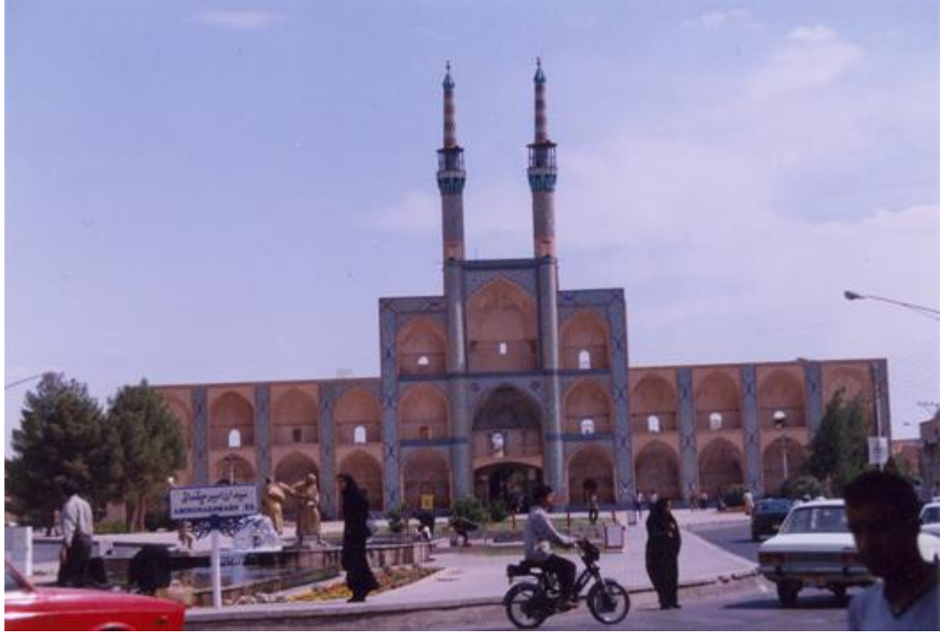
میدان و تکیه میرچخماق یزد