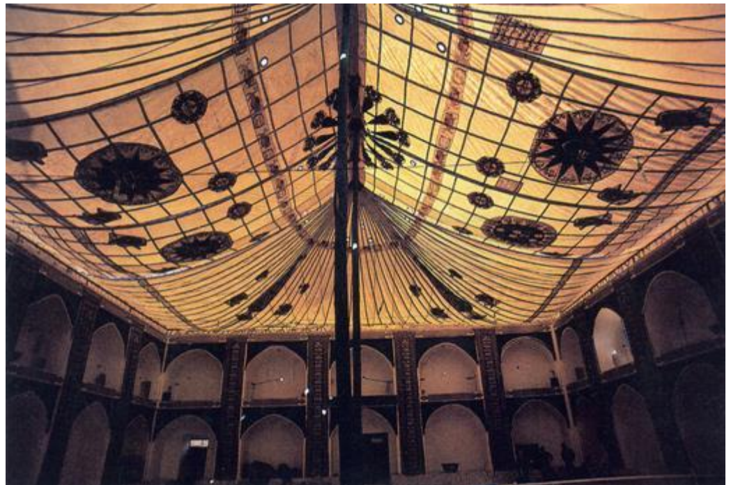
حسینیه فهادان یزد