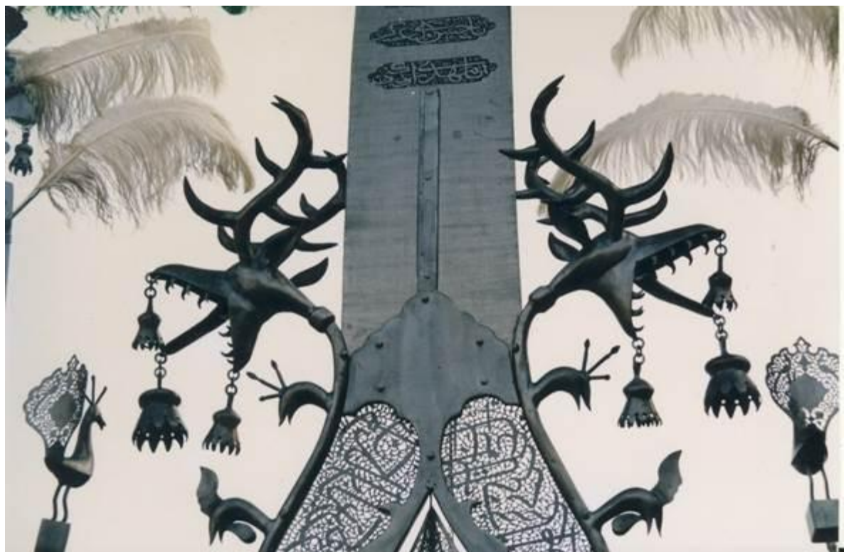
تزئینات علم در شهر بابل