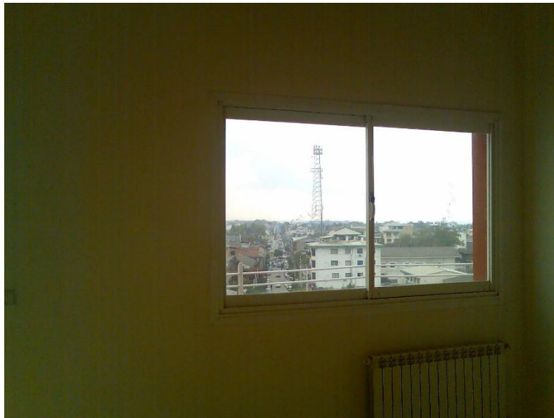
؟ ۴-۱ پنجره ( ساختمان پزشکان ترنج واقع درنوشهر

طوری که مانع لانه گیری حشرات خانگی در پشت آن شود.