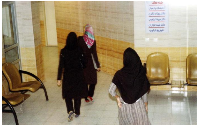
دیوارهای داخلی (پوشش بدنه دیوار اتاق تزریقات)