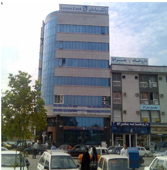
ساختمان پزشکیان واقع در بابل

ساختمان یا مجتمع پزشکیان به مجموعه ای از مطب های پزشکی اطلاق می گردد که هر پزشک بطور مستقل به معاینه و مداوای بیماران می پردازد و ساختمان پزشکیان موسسه پزشکی محسوب نمی گردد. (تبصره ۲ از ماده ۲ خدمات بهداشتی و درمانی)