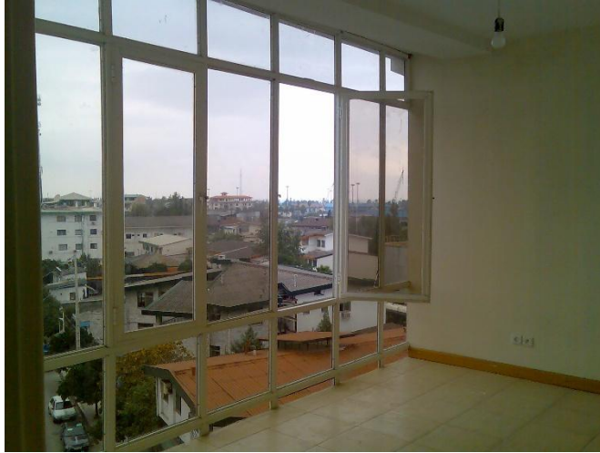
کف (پوشش کف و دیوارها ی داخلی