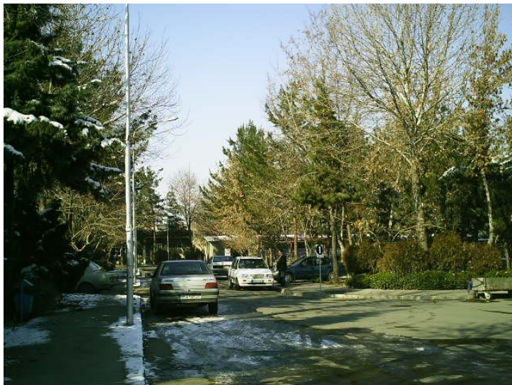
مسیر سواره رو (بیمارستان دکتر حجازی، تهران)

مسیر ماشین رو باید بین در ورودی اصلی و سایر ورودی ها مانند رادیولوژی و آزمایشگاه و محل توقف اتومبیل های شخصی قرار گیرد.