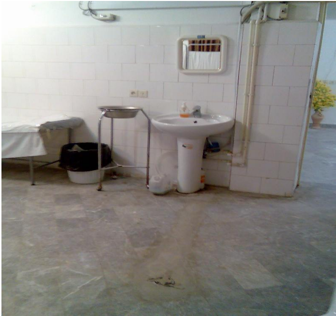
دیوارهای داخلی (نمونه ای از سنگ و دیوارهای داخلی)

۵- پوشش دیوارها لازم است تا ارتفاع ۱,۸۰ متر از کف و یا بیشتر از سایر مصالح قابل شستشو و مقاوم به رطوبت ساخته شود باید صاف و صیقلی و بدون درز و شکاف بوده و کاملاً چسبیده به دیوار باشد به