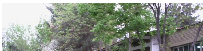
۱-۲- نمونه ای از محوطه در ساختمان پزشکان تهران (آریاشهر)