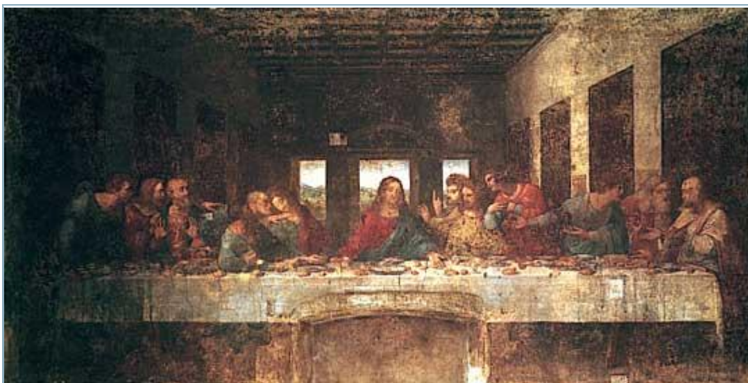
شام آخر اثر لئوناردو داوینچی

به این موارد می توان گچ ، مداد گرافیت ، پارچه کهنه یا دستمال کاغذی ، آینه که گاهی برای تغییر