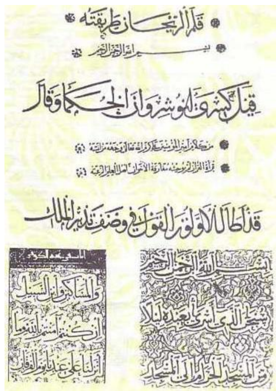
خط ثلث و نسخ

اصل و ریشه خط محقق از کوفی است . واضع آن ابن مقله بیضاوی بود و چون خط کوفی را پنج دانگ و نیم سطح و نیم دانگ دور بود ، در خط محقق یکدانگ از سطح آن کاسته و به دور آن افزود و به این ترتیب که در خط محقق چهار دانگ و نیم سطح و یکدانگ و نیم دور معین است . خط ریحان تابع قلم محقق است ، هر دو از يك اصل به وجود آمده اند و سطح و دور آن مانند محقق است . جز در حروف (( ی )) که دور آن در محقق بیشتر است واضع آن ابن مقله وزیر بیضاوی است .